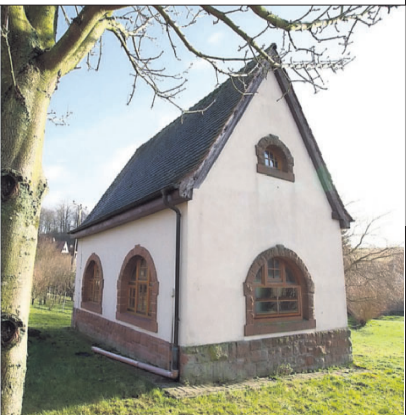
lautern, ist das ganz genauso. Hier gibt's sogar noch ein ehemaliges „Wasserhaus“. Unser Fotograf hat ins rechte Foto 6 Fehler eingebaut. Findet ihr sie? Die Auflösung steht im Anzeigenteil der heutigen RHEINPFALZ.