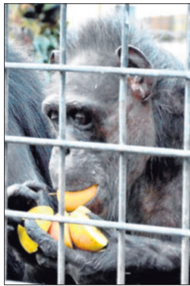
Bitte Abstand halten: Schimpansen gehören in Gefangenschaft zu den gefährlichsten Tieren. Deshalb ist zwischen ihnen und den Tierpflegern immer ein Zaun (Foto links).